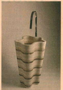
Margraf. Lavabo da terra Nuvola